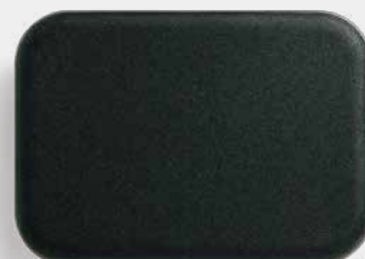
929デンタルセンサー (L)