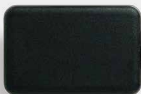
929デンタルセンサー (S)