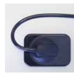
耐塵ケース/ 耐久ケーブル