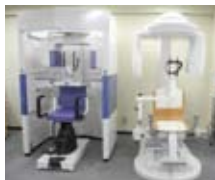
店舗で実際の画像を比較できます