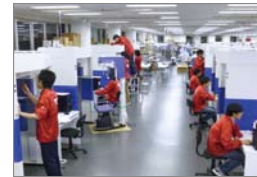
近日、ライブカメラで各地の生産現場を HPで公開します。

量産による大幅なコストダウンと 納品を地産地消にすることで 現地雇用を増やし…輸送コストさえもケチり 結果、安価での販売を可能にしました。