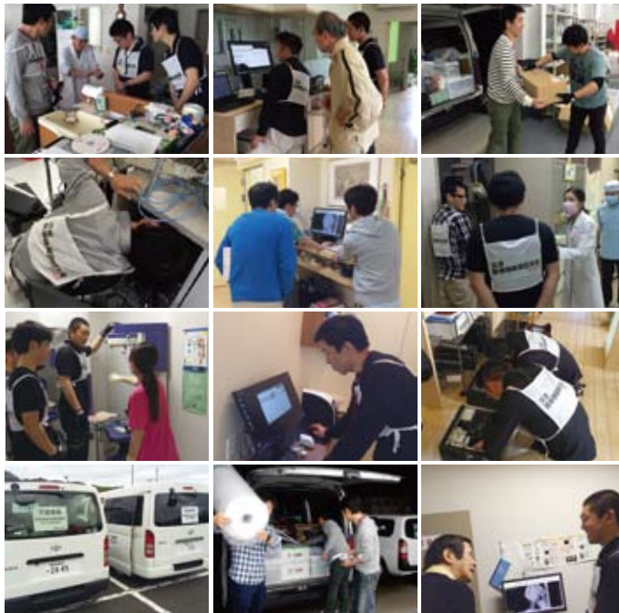
修復支援チームからの報告写真

活動内容：震災によって支障が出ている当社機器の復旧 他社レントゲン関連機器の簡単な点検