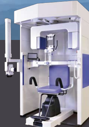
デンタル拡張タイプ