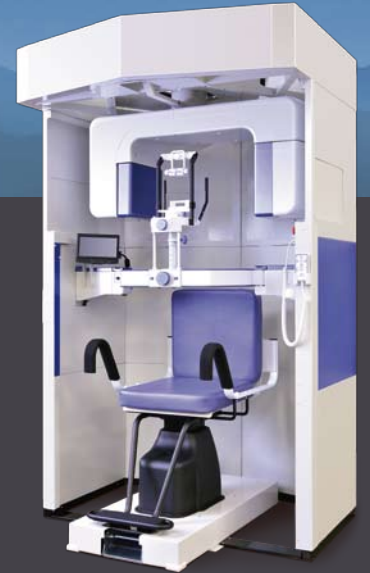
CT+パノラマ複合機 CT専用機/パノラマ専用機