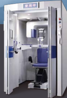
X線室のいらないCT X線遮断BOX デンタル対応タイプ