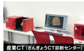
産業CT (さんぎょうCT診断センター)

「くまモン」と「はなげ忍者」が コラボレーションしました (熊本県公認 許諾番号:#K29703)