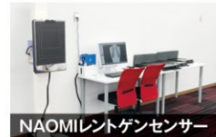
NAOMIレントゲンセンサー