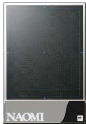
※5年間丸ごと安心保守もご用意

現在お使いの他社製品 下取り乗り換え可能 (メーカー問わず どんなに古くてもOK) 他社CRからは 140万円 (月々19,000円)