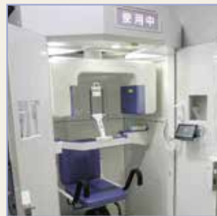
撮影室から写真を診察室へ直ぐに転送