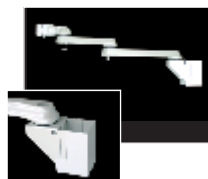
チェアサイドボールに取り付ける場合はボールマウントアーム