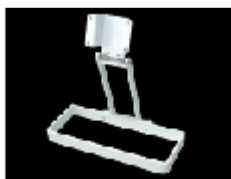
デスクトップ標準型

コペルニクスは院内改造等の大掛かりな工事をせず設置ができ、見た目にもこだわって開発時よりデザインしました。だから誰にでも簡単に取り付けができます。また院内環境が異なるそれぞれの医院様に対応できるよう取り付け金具を選べるようにした事もちょっとした工夫の一つです。