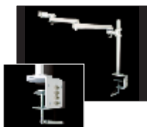
棚やデスクに取り付ける場合にはクリップ式のデスククランプ