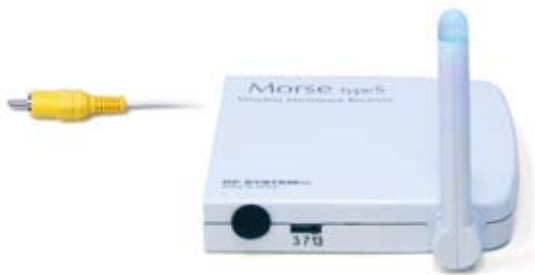
TV用ワイヤレス受信機

アールエフ製ワイヤレス口腔内カメラからの画像を受信。 今欲しい画像をテレビやパソコンで瞬時に確認することができます。