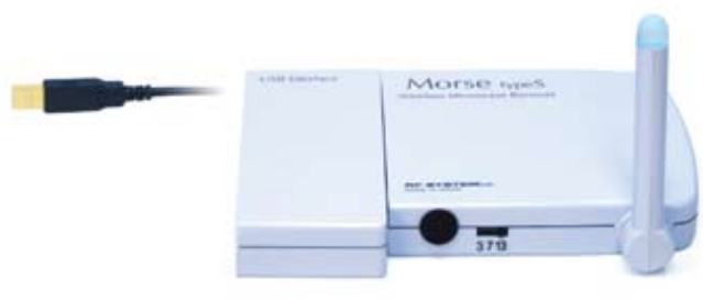
PC用ワイヤレス受信機