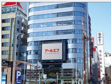
名古屋店 (名古屋駅前)