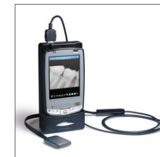
歯科用デジタルX線 CCDセンサー DX-150