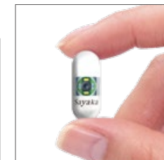
次世代カプセル内視鏡 Sayaka