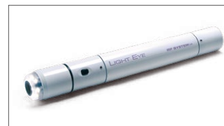
多目的カメラ Light Eye