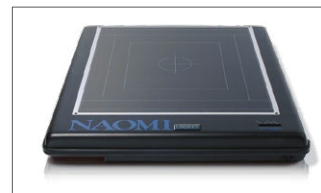
高解像度デジトゲン NAOMI HG