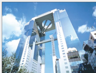
大阪店 (梅田スカイビル 35F)