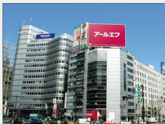
東京店 (東京八重洲口前)