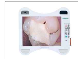
多機能モニター Copernicus Color