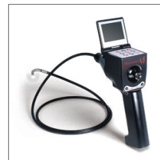
360度先端可動工業内視鏡 VJ

デジタルX線センサーシェアNo.1獲得 (一般診療所におけるデジタルX線 (DR) の納入実績)