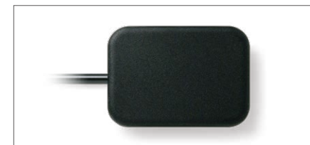
医療用USB対応デジタルX線 デンタルセンサー NAOMI-DX