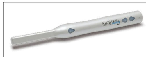
医療用ワイヤレス口腔内カメラ Einstein lumica

医療用簡単スマートワイヤレス口腔内カメラ「Einstein Jr.」 φ6.9mm 360度先端可動内視鏡「VJ-ADV」 きれいなX線 (Crestpath X-Ray) 研究着手 医療用セファロデジタルX線センサー「NAOMI-DCX」