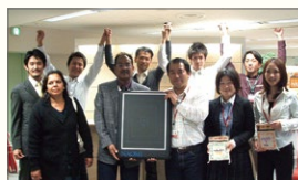
ネパールのカンチ小児病院に「NAOMI」一式を寄付

医療用簡単スマートワイヤレス口腔内カメラ「Einstein Jr.」 φ6.9mm 360度先端可動内視鏡「VJ-ADV」 きれいなX線 (Crestpath X-Ray) 研究着手 医療用セファロデジタルX線センサー「NAOMI-DCX」