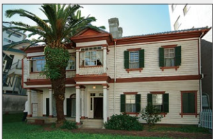
神戸店 (神戸北野異人館 旧スタデニック邸)