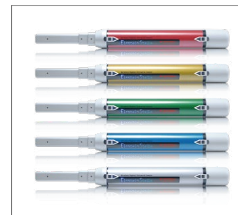
鮮やかビタミンカラー5色 歯科用口腔内カメラ Einstein Stella

10周年記念モデル口腔内カメラ「Einstein Limited」 歯垢検出専用ワイヤレス口腔内カメラ「EinsteinStella Plaque」 次世代動画/メモリー液晶モニター「Doga」 2年連続デジタルX線センサーシェアNo.1 獲得 (DR 部門 外部調査機関調べ)