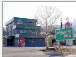
松本事業所 土地: 650坪 建物: 延べ150坪 12月稼働

2015年 (270名) 敷地累計: 30,740坪 建物累計: 13,673坪