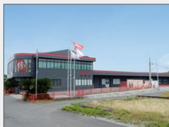
鹿児島事業所 土地: 1,726坪 建物: 延べ850坪 10月稼働

2015年 (270名) 敷地累計: 30,740坪 建物累計: 13,673坪