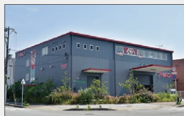
神戸事業所 別館 土地: 304坪 建物: 延べ370坪 2018年12月稼働 (拡大移転)