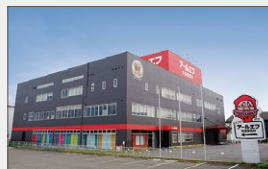
中央研究所 土地: 756坪 建物: 延べ1,069坪 9月稼働