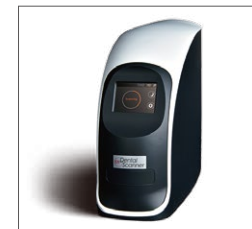
医療用 929デンタルスキャナー (RF929)