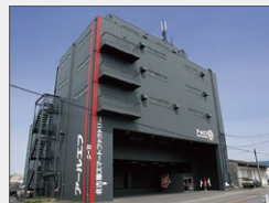
名古屋事業所 土地: 285坪 建物: 延べ923坪 2016年6月稼働