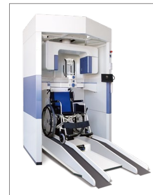
NAOMI-CT 車いす対応タイプ

「NAOMI-CT」鉛BOX デンタル拡張タイプ 医療用929デンタルチェア (RF929) 米国カイロプラクティック大学 (3校) にてデジタルX線センサー NAOMI 採用