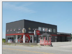
新潟事業所 土地: 500坪 建物: 延べ190坪 11月稼働 (拡大移転)