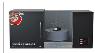
産業用 NAOMI-CT NINJA

医療用929X線防護エプロン (RF929) 医療用929X線防護指サック (RF929) 医療用929ポータブル照射器 (RF929) 動物用929ポータブル照射器 (RF929) 医療用929デンタルセンサー (RF929) 980万新規開業バック案内開始