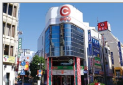
長野駅前商業施設「Cone」 「アールエフ Cone」となる (子会社 RF929 所有) 土地: 432坪 建物: 延べ1,931坪