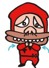
わんさかーえがお