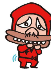
わくわくほくほーくー