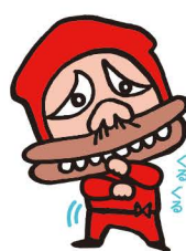
にんころぼんぼんぼーん