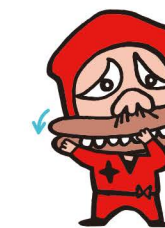
だっだんだっだ〜ん