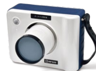
ポータブル照射器