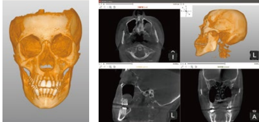
CT【大きな撮影サイズ Lパネル】