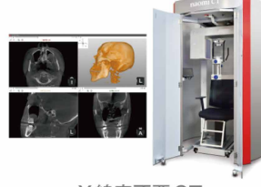
X線室不要CT 大きな撮影サイズ Lパネル