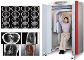
2管球 平面パネル 特大LLサイズ