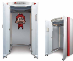
工事を伴うX線室はもう不要!